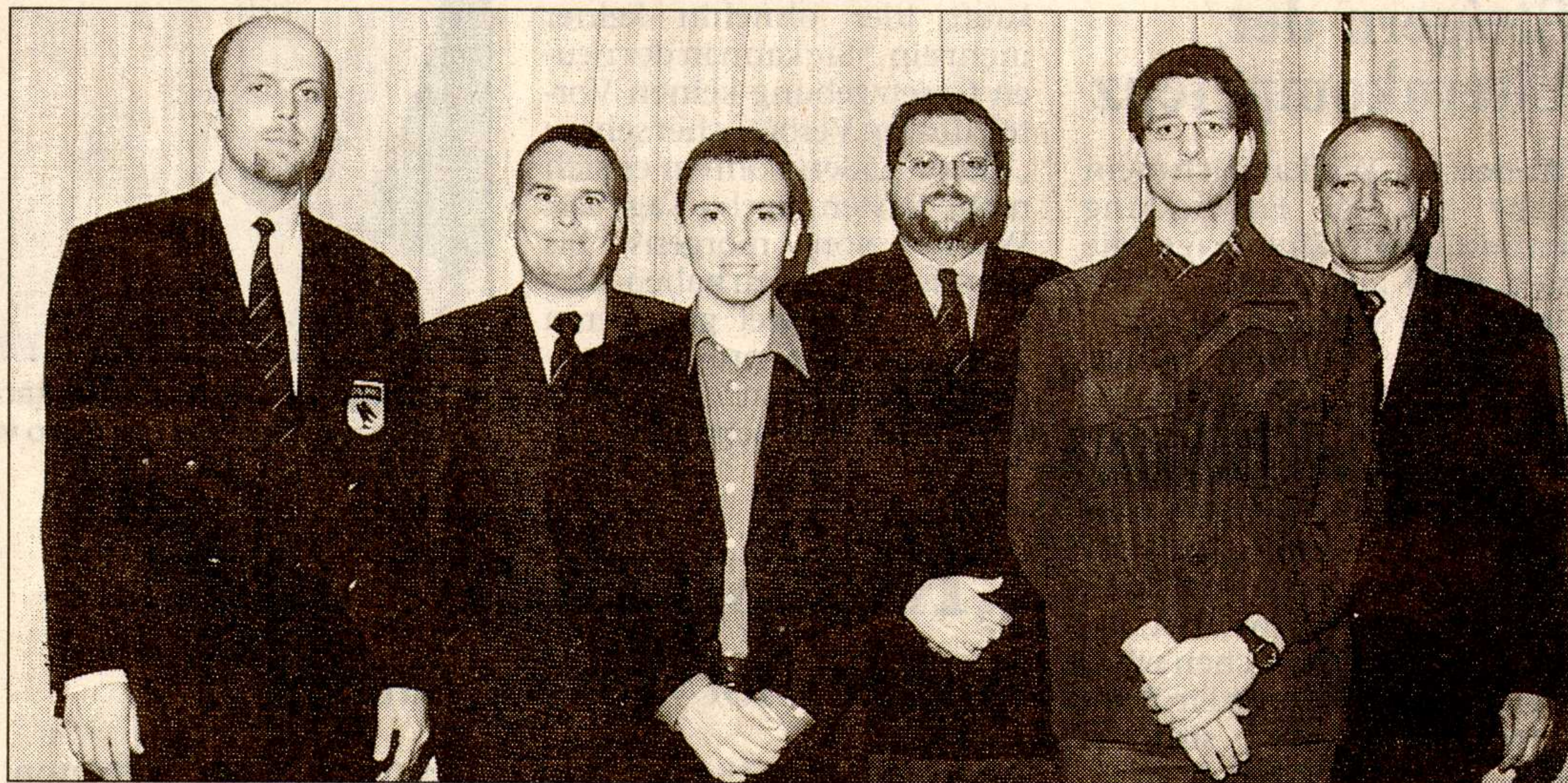
Ein Teil des alten und gleichzeitig neuen Vorstands der DLRG Wedel.

den vielen Helfern, die am Umbau der Rettungswache am Strandbad mitgeholfen haben und noch weiter mit Hand anlegen. „Selbst bei schlechtem