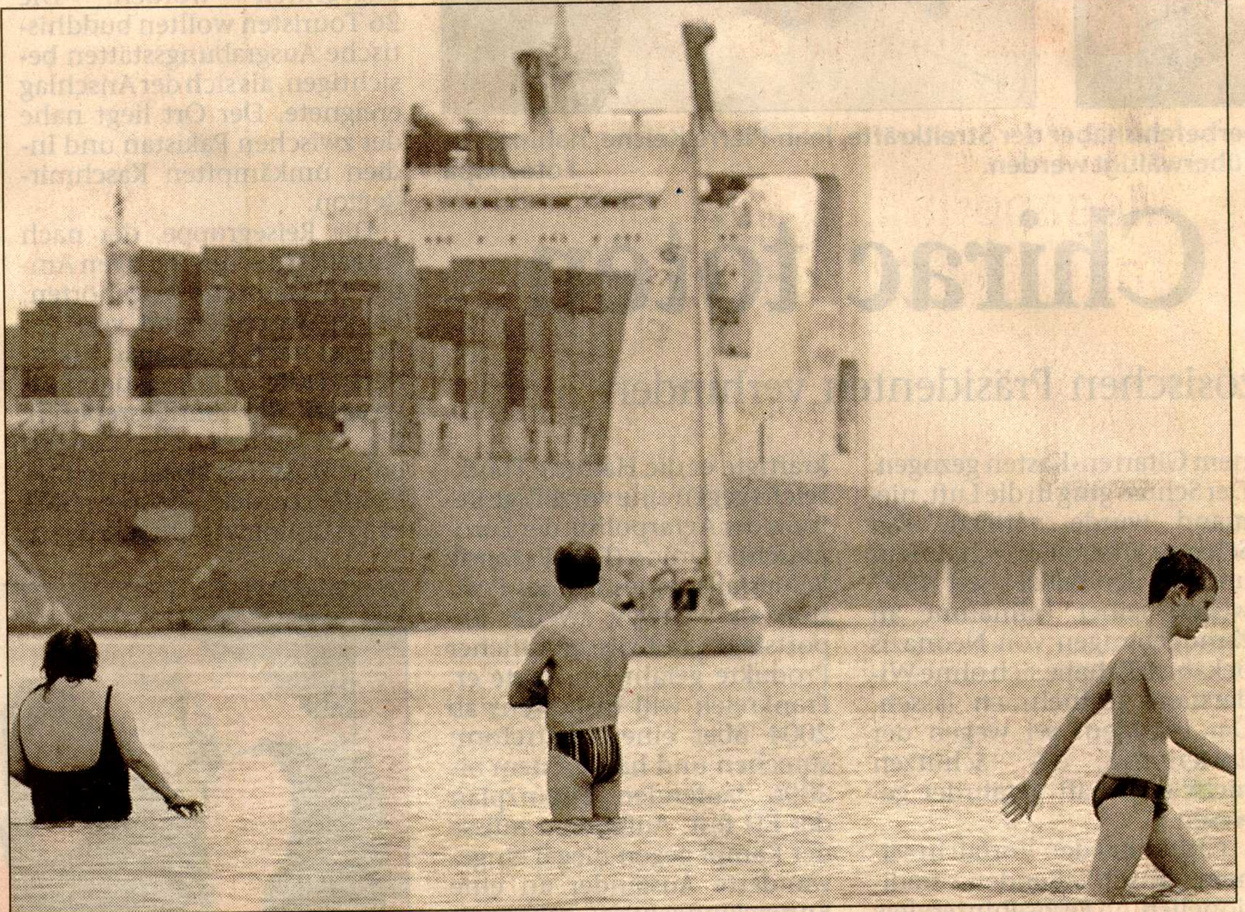
Typisch für das Bad in der Elbe: Schwimmer und ein Containerriese treffen sich in Höhe Witten-bergen.

In Hamburg gab Umweltse-nator Peter Rehaag (Schill-Par-tei) den Startschuss zum Sprung in die Fluten in Witten-bergen westlich der Stadt. Wassertemperatur: 20 Grad. Mehrere hundert Menschen wagten sich hier ins erfrischen-